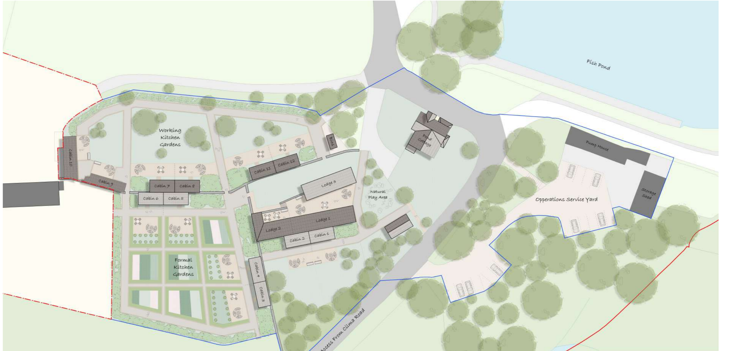
Cynllun sgmategig o batrwm gerddi llysiâu'r Gegin ar ôl eu hadfer a'r llety cysylltiedig i ymwelwyr