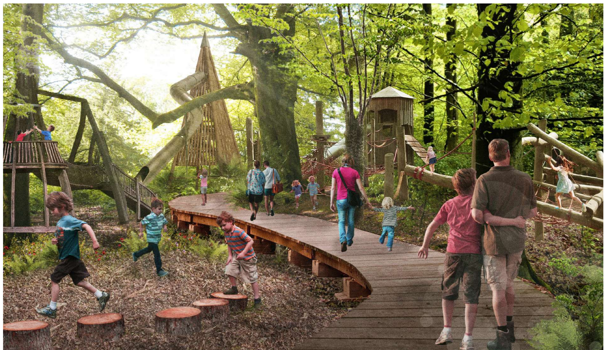
[B3] Delwedd gysniadol yn dangos Chwarae Coetir – elfennau cerflun sy'n cynnig chwarae anffurfiol sy'n cysylltu â themâu deongliadol y rhan hon o'r safle.