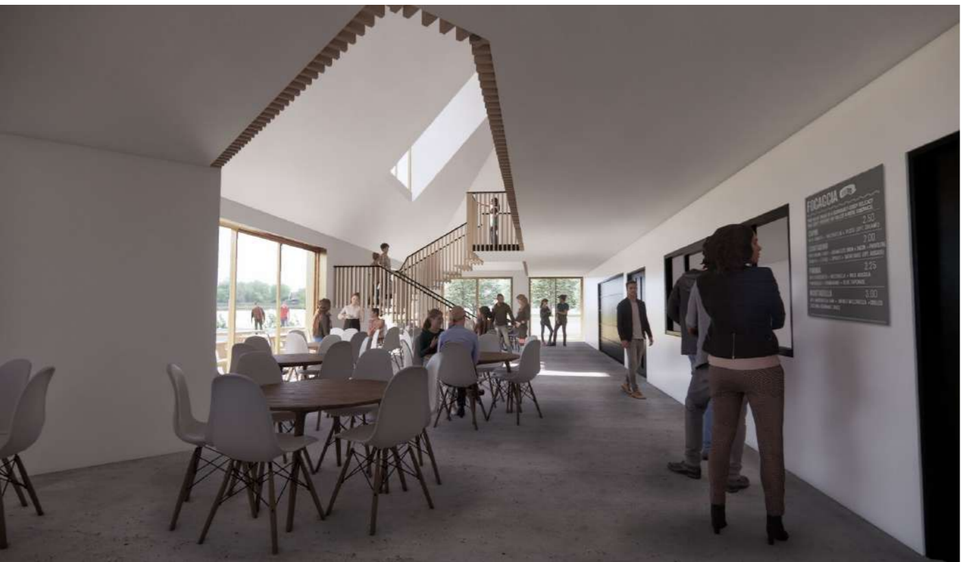
Golygfa fewnol o'r newidiadau arfaethedig