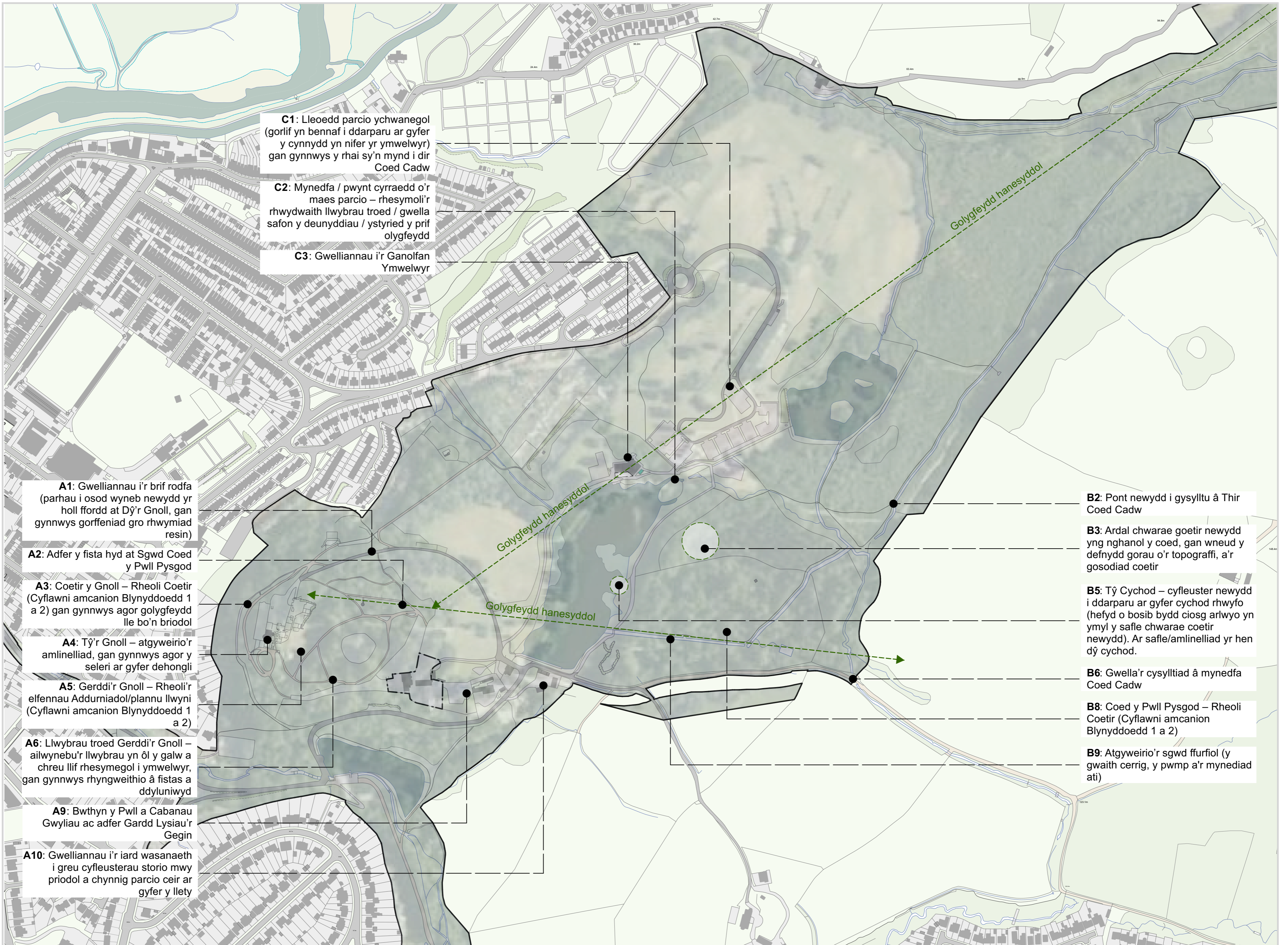
Strategaeth Gyffredinol y Parc