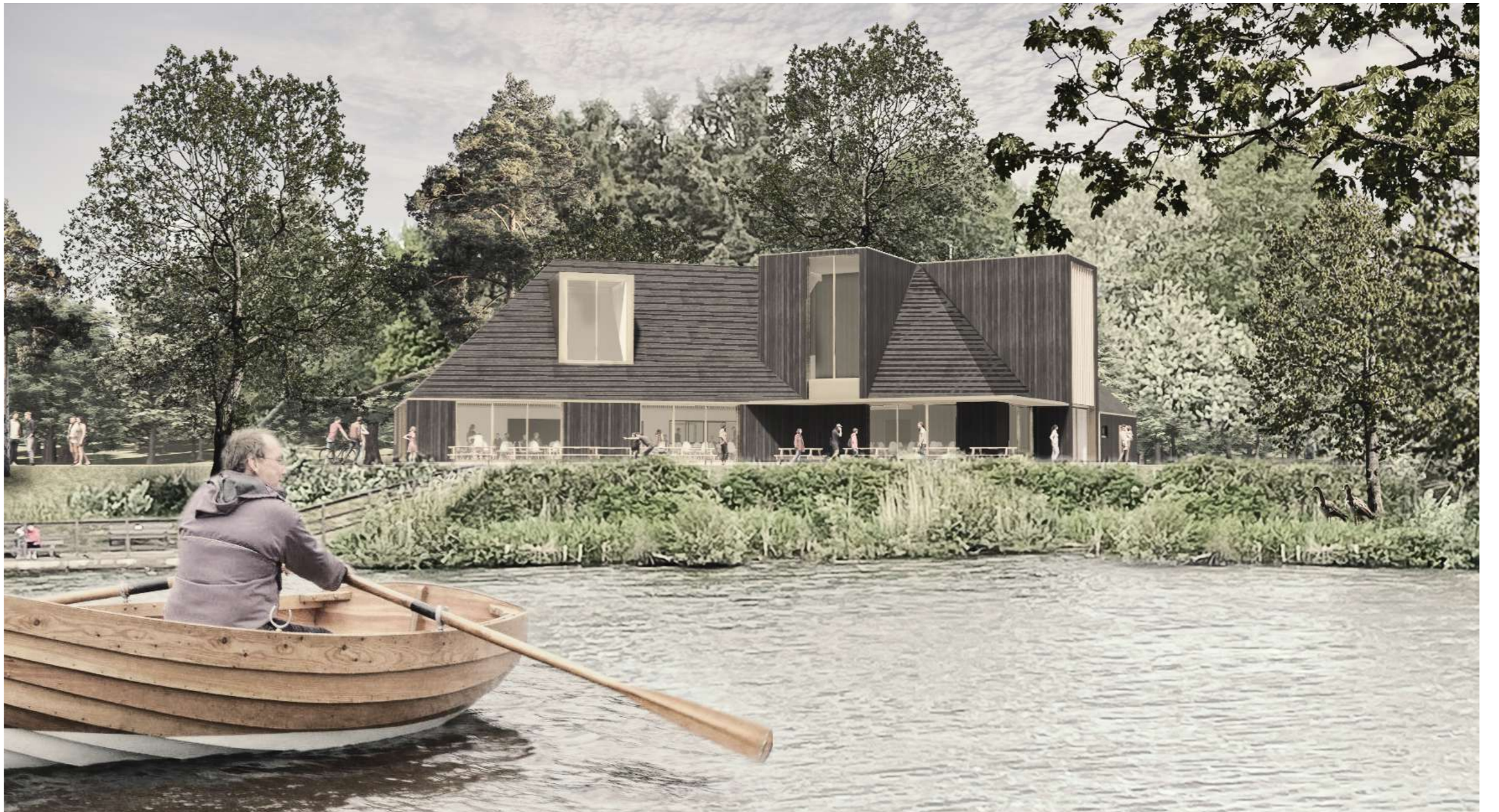
Mae'r cynnig yn creu adeilad newydd fel dehongliad modern o'r mudiad celf a chrefft, gyda goledf serth i'r to, yn adleisio Bwthyn y Pwll ar ochr arall y llyn, er mwyn darparu cyfleusterau ychwanegol. Mae'r golygfeydd yn cael eu fframio, a cheir gwell cysylltiad â'r parcdir.