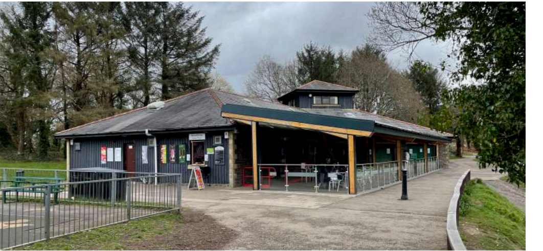
Er ei bod yn weithredol, mae adeilad presennol y ganolfan ymwelwyr/caffi yn methu â chyflawni ei botensial i roi profiad fydd yn ysbrydoli ymwelwyr. Nid oes patrwm clir i'r adeilad, ac felly mae'n anodd i ymwelwyr ddeall sut mae mynd trwy'r adeilad 'y ffordd gywir'. Mae'r bensaerniaeth yn amddiffynnol, ac ni wneir y gorau o'r golygfeydd dros y llyn na'r golygfeydd i'r rhannau mewnol. Mae hyn yn lleihau'r cysylltiad â'r parcdir.