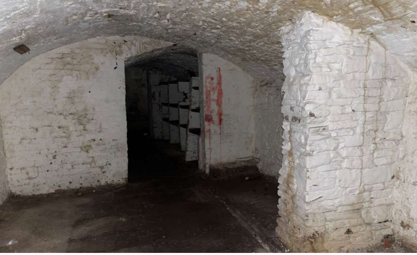
Golygfa fenol o'r seleri presennol