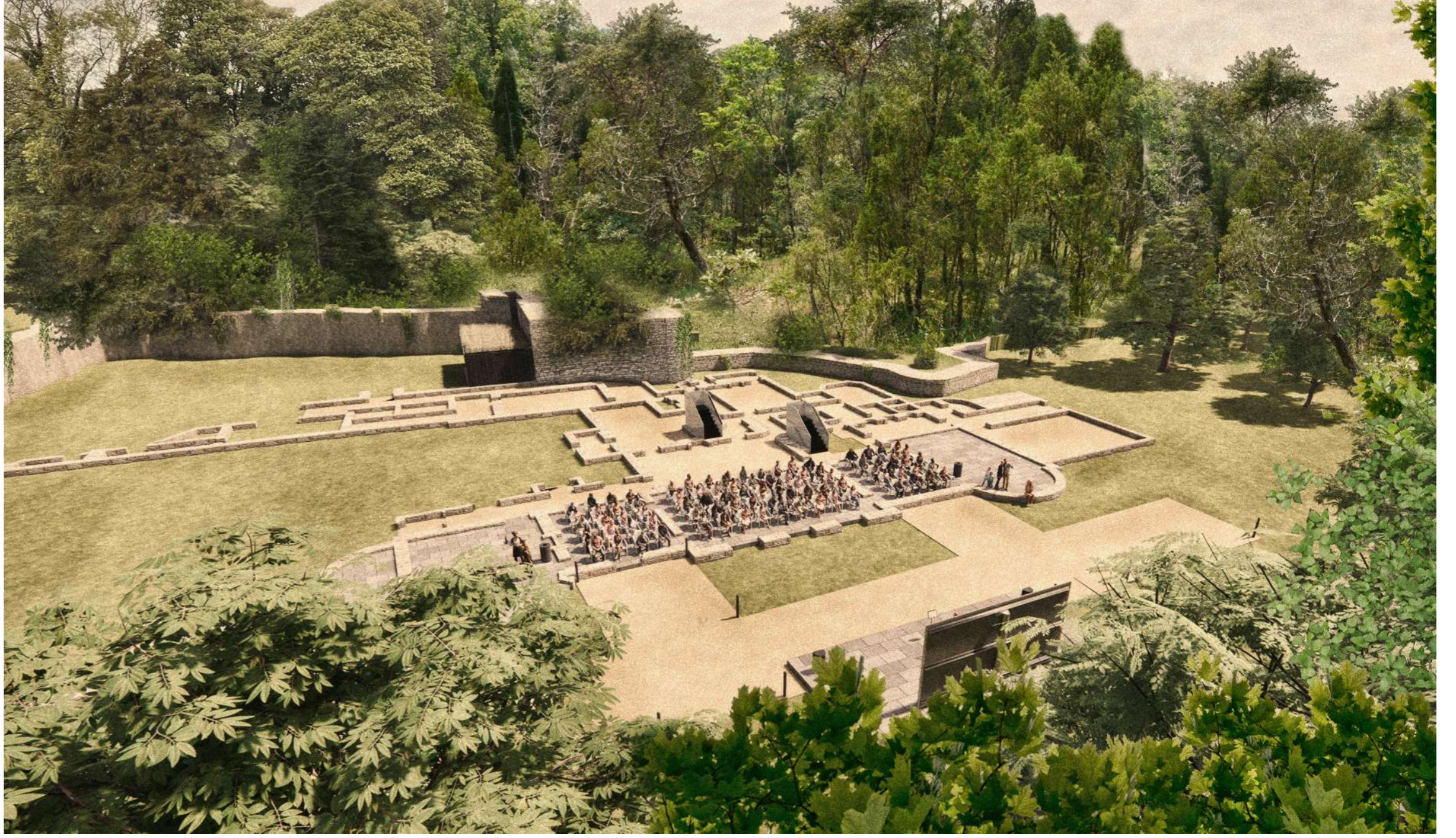
Mae'r cynnig yn diffinio ac yn dehongli amlinelliad y tŷ gwreiddiol yn well, trwy dirlunio caled a meddal, ond hefyd yn darparu defnyddiau newydd dichonadwy: gan gynnwys sgriniadau sinema/perfformiadau cerdd a theatr, ochr yn ochr â darpariaeth addysg a dehongli rhyngweithiol ar gyfer y seler.